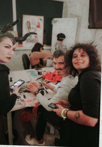
Halloween - octombrie