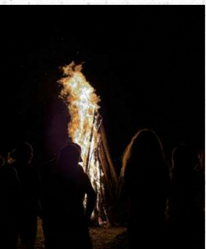
Teambuilding - iulie