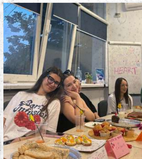
Cooking with Heart - mai