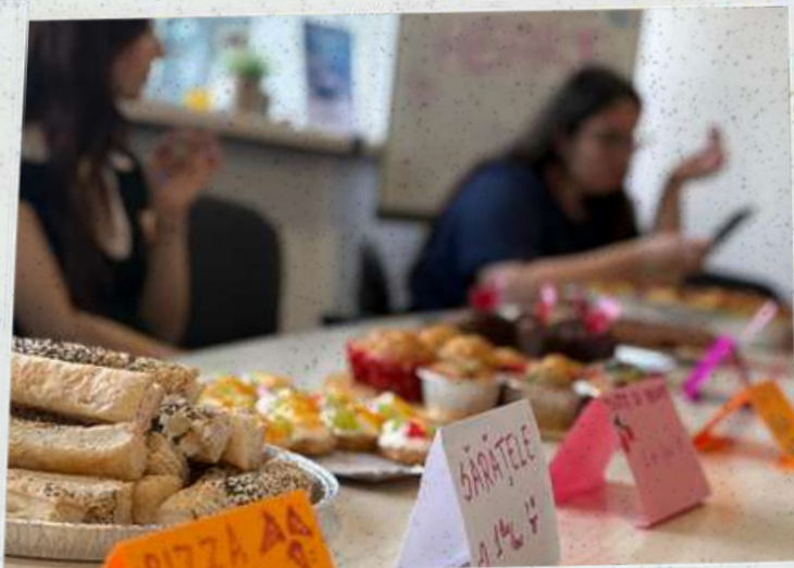
Cooking with Heart - noiembrie