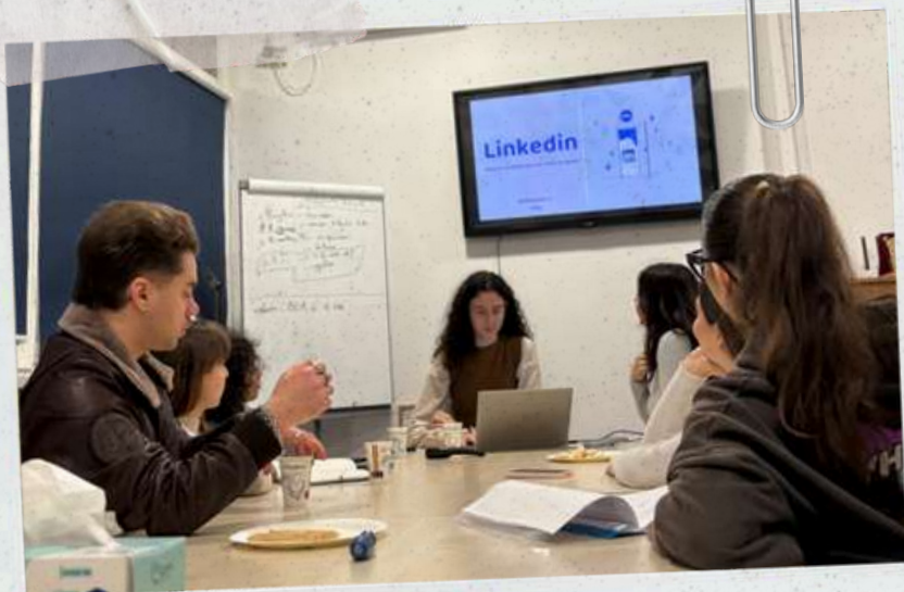
LevelUp LinkedIn - noiembrie