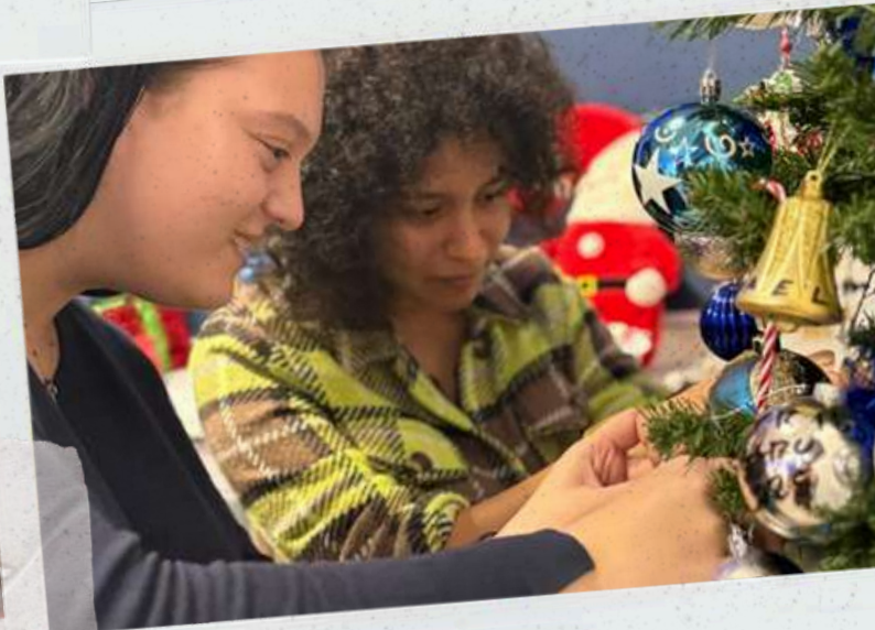
Tradiție de Crăciun - decembrie