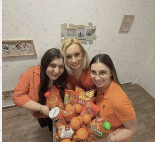
Color Party - martie