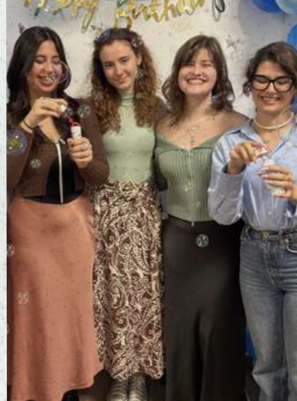
Ziua ATTU - mai